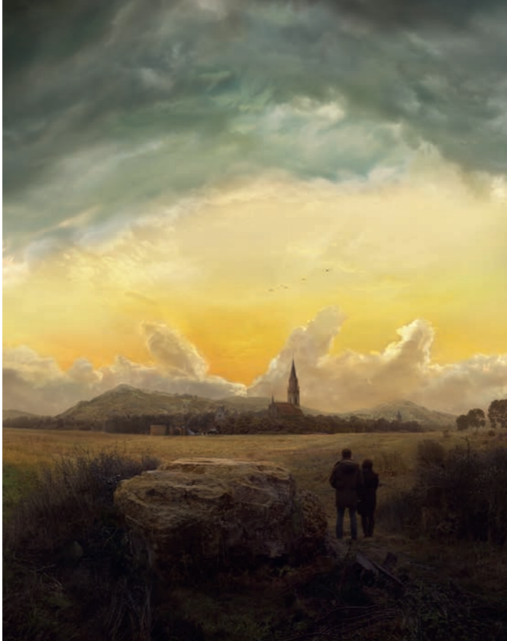
after C. D. Friedrich, Neubrandenburg 1816/17, No. 3, 2022

» Mein Ziel als Künstler ist Selbsterfahrung. Eine Vorstellung vom eigenen Äußeren erlangen wir beim Blick in einen Spiegel oder mithilfe der Kamera. Das Innere, Seele und Geist, lässt sich auf diesem Wege jedoch nicht ergründen. Um es wahrzunehmen, braucht man eine andere Person. Sie spiegelt das eigene Innere. Vermutlich sehe ich mein Inneres am deutlichsten, wenn es sich in einer Person spiegelt, die mir entweder sehr nahe steht (wie meine Eltern oder meine Kinder) oder sehr fern ist. Seit 20 Jahren lebe ich, ein Japaner, in Deutschland. Ich habe Caspar David Friedrich als die andere Person gewählt, die mein Inneres spiegelt – und zwar nicht ohne Grund. «