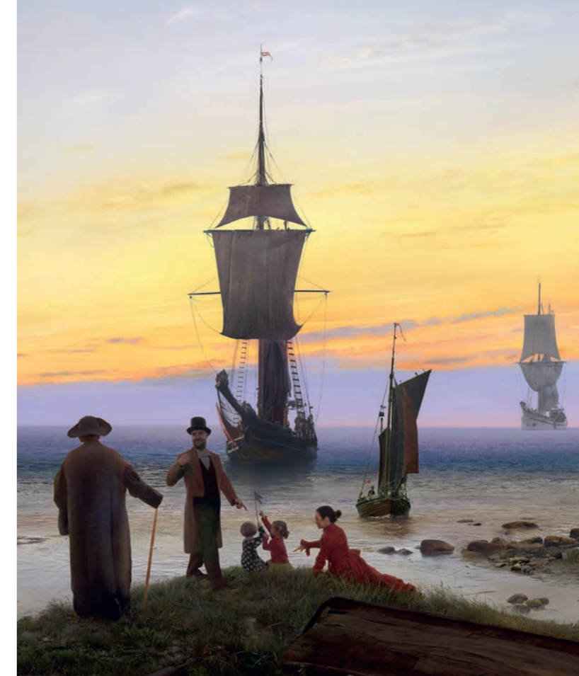
after C. D. Friedrich, Landschaft auf Rügen mit Regenbogen 1830, 2016